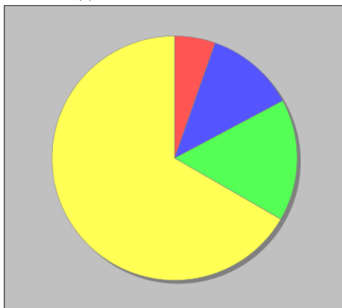
Distribuzione dei docenti a T.I. per anzianità nel ruolo di appartenenza (riferita all'ultimo ruolo)